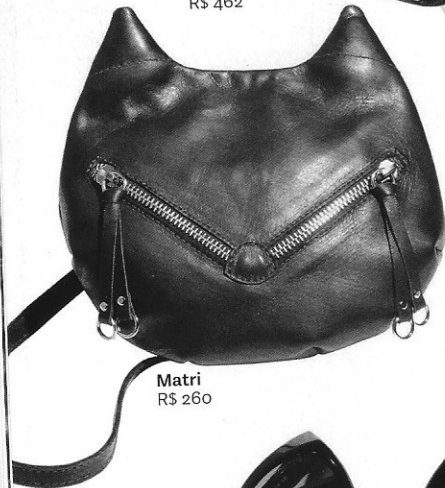
Matri R$ 260