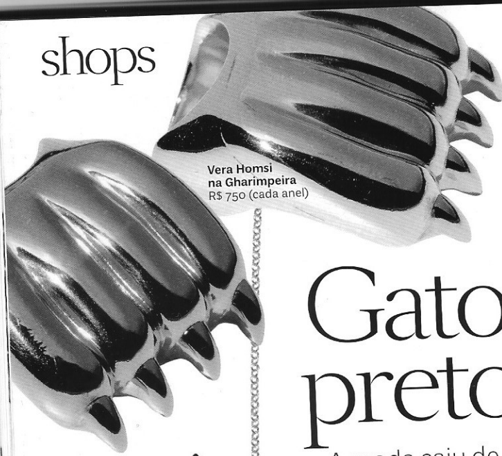
Vera Homs na Gharimpeira R$ 750 (cada anel)