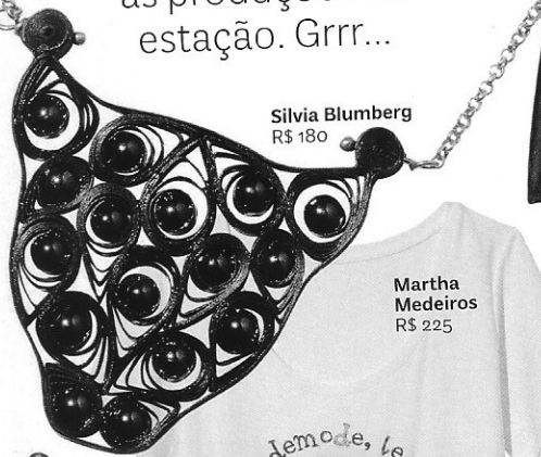
Silvia Blumberg R$ 180