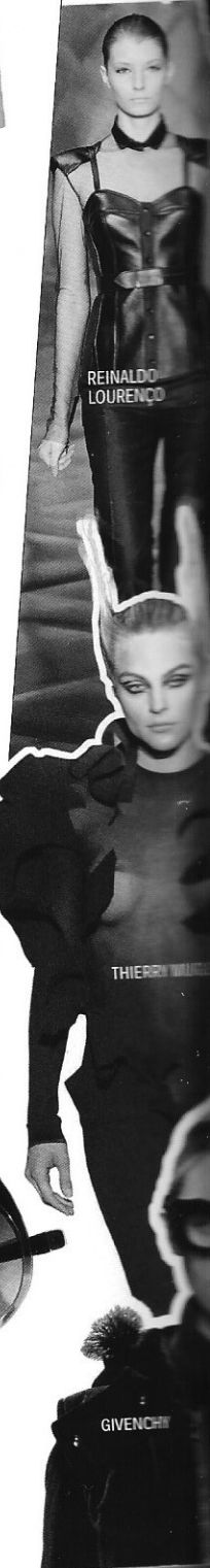
Dsquared2 na Marcolin R$ 903