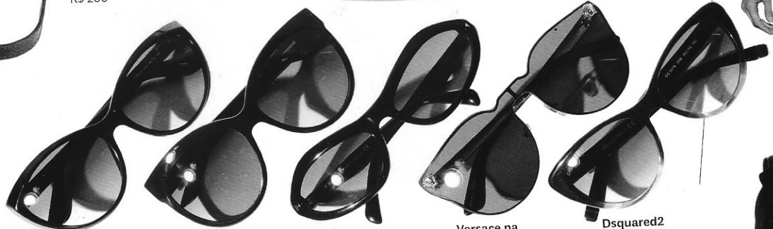
Tom Ford na Marcolin R$ 1.151