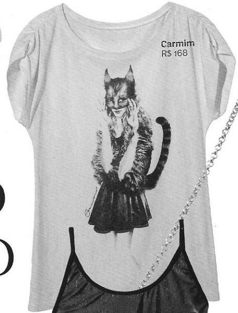
Carmim R$ 168