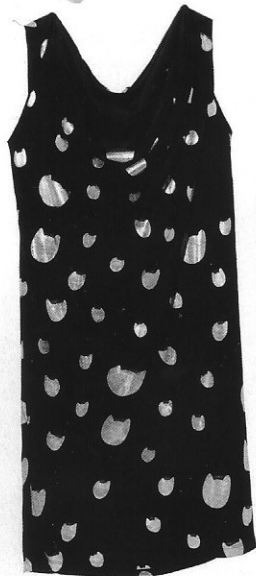
Super Suite 77 R$ 462