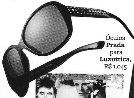
Óculos Prada para Luxottica , R$ 1.045