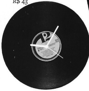
Relógio de parede Imaginarium , R$ 43