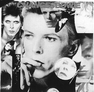
Vinil Changes Bowie Discomania , R$ 33